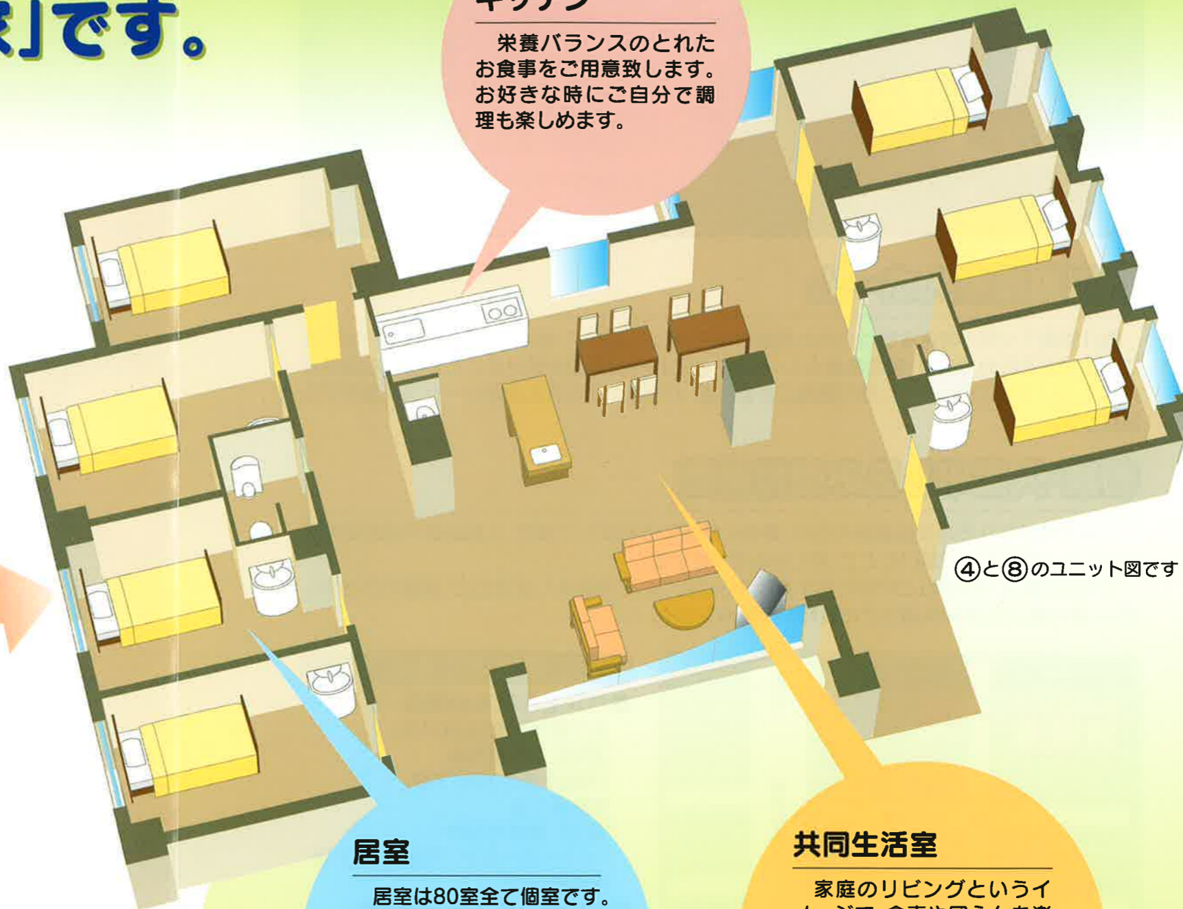
④と⑧のユニット図です

栄養バランスのとれたお食事をご用意致します。お好きな時にご自分で調理も楽しめます。